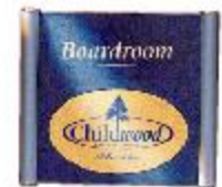
Profil 312 (A3)