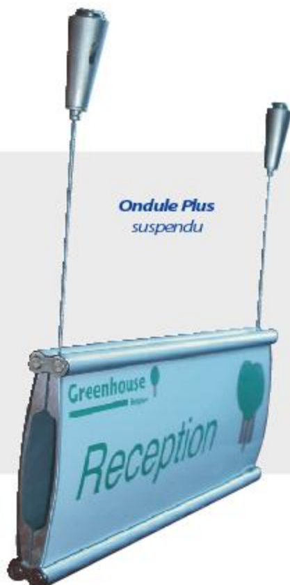
Ondule Plus suspendu